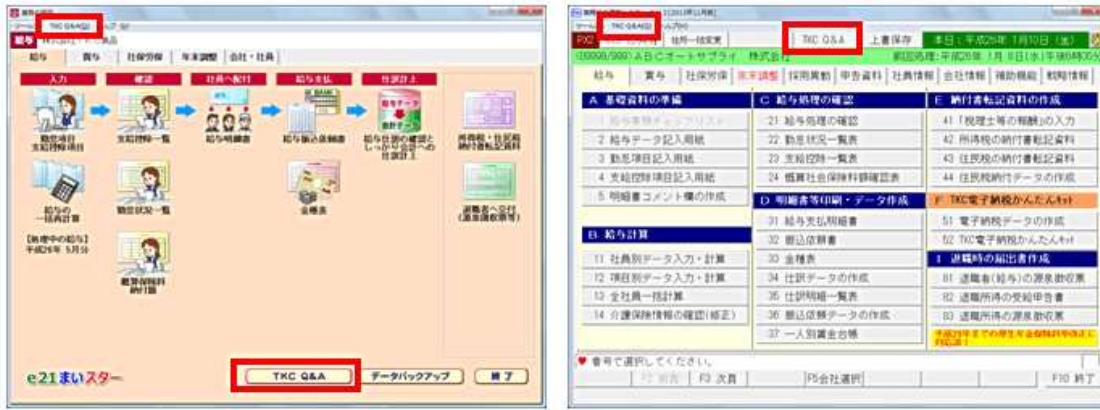
■ 「TKC Q&A」メニュー